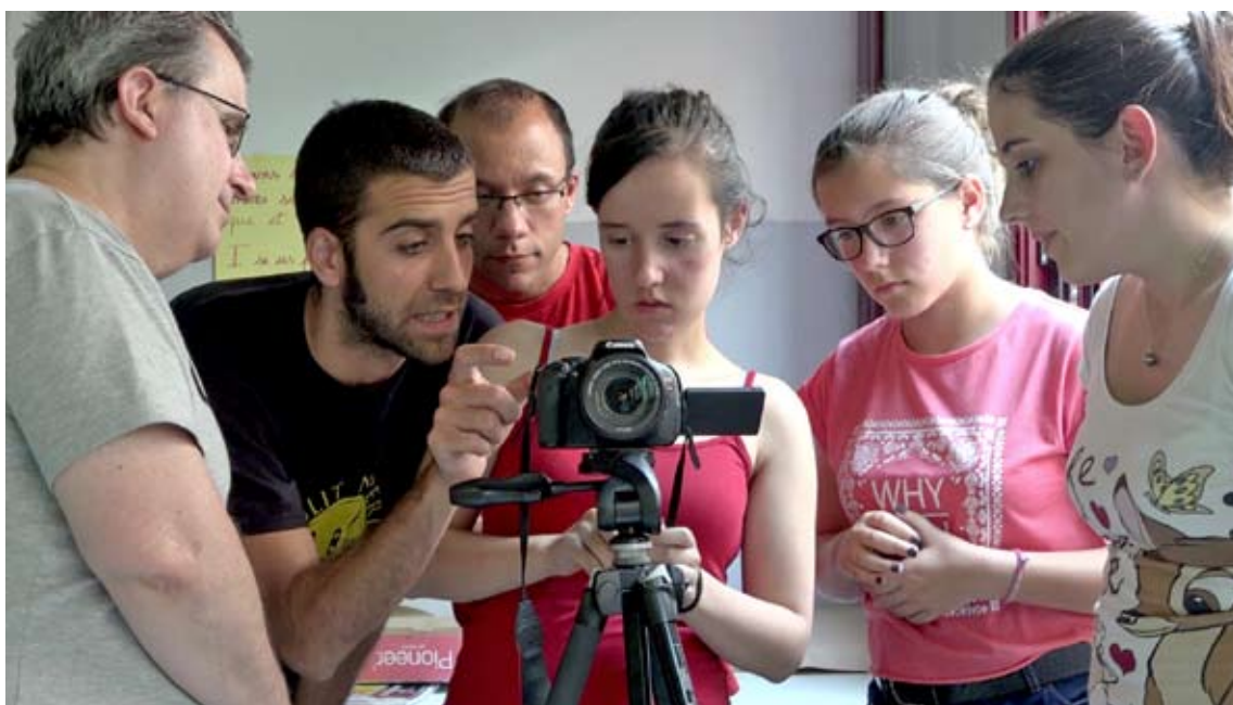
Formació tècnica, elements bàsics de la càmera DSLR. Barcelona, abril de 2016.