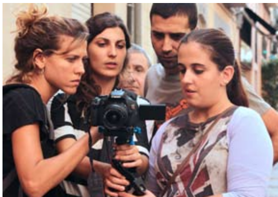
Moment durant la gravació participativa del DSP Viure al límit . Barcelona, maig de 2016.

diferents tipus d'interaccions que es donen entre les persones de qualsevol tipus d'agrupació. Va néixer com un treball amb el cos i els somnis i té les seves arrels en la psicologia junguiana , la nova biologia i el taoisme.