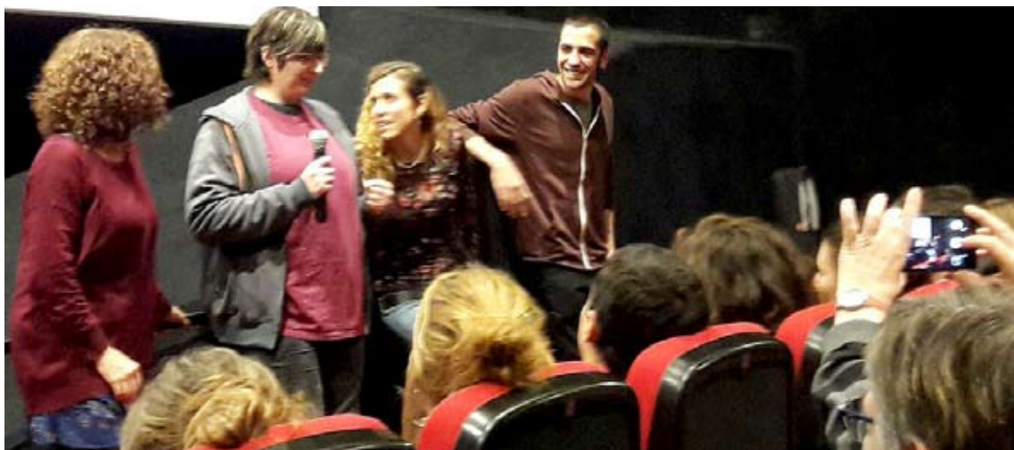
Fòrum posterior a la projecció, amb les protagonistes explicant l'experiència. Cinemes Texas, 15 de desembre de 2016.