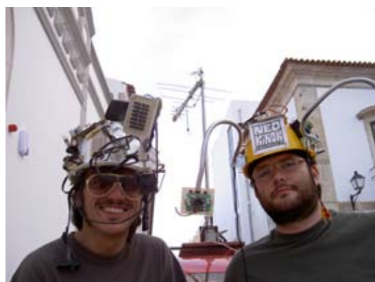
Col·lectiu Neokinok amb prototips autoconstruïts. Projecte de Televisió Experimental Participativa al Festival Citemor, Montemor-o-Velho, Portugal, 2005.

Forés (2016) escriu sobre la noció de DIY que és “una filosofia que posa els estudiants en el centre de l'experiència d'aprenentatge, convertint-los en els creadors del seu propi procés d'aprenentatge i materials”. I afegeix: “Sorgit als anys 90 amb les arts, l'artesanía i les noves tecnologies, ara és freqüent en els continguts curriculars, donant als educadors i als estudiants l'oportunitat de crear, compartir i aprendre en col·laboració”.