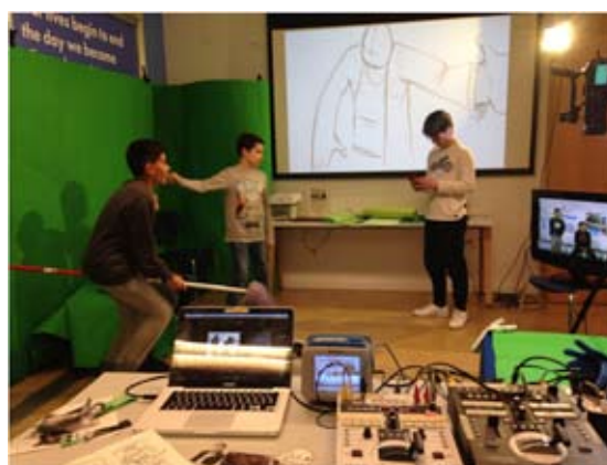
Plató amb doble chroma key . Taller ARTv amb joves a Can Fabra. Barcelona, 2016.

A la propera sessió, farem servir les eines i els coneixements que hem après a l'anterior. Només tenim un punt de partida, algunes idees, dibuixos inacabats, de vegades una llunyana promesa d'una exposició futura de les produccions que resultin del taller, si es que n'hi ha.