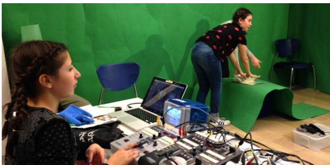
Plató amb doble chroma key . Taller ARTv amb joves a Can Fabra. Barcelona, 2016.